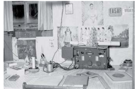
TORN E. B.