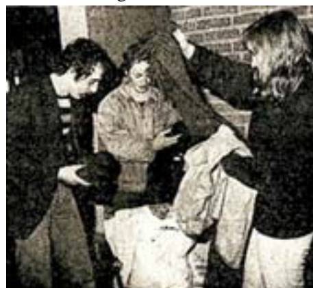
De tre flygtninge ekviperes

I perioden fra 1961 til muren faldt i 1989, var der henvend 6.000, der forsøgte at flygte over Østersøen, men det var desværre langt fra alle, der opnåede friheden. Man regner med, at kun ca. 1000 østtyskere nåede sikkert over Østersøen, resten blev enten fanget af „volkspolizei“ eller er druknet under forsøget!